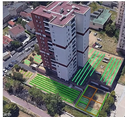
Jardin urbain aux Tarterêts

Projet – Le Jardin de la Roche – Villebon-sur-Yvette