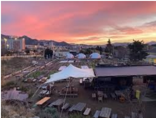
Le Talus à Marseille