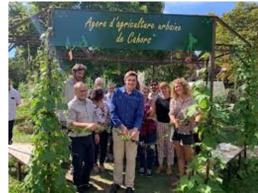
Autonomie Alimentaire Cahors

https://agora-agriculture-urbaine-46.jimdosite.com